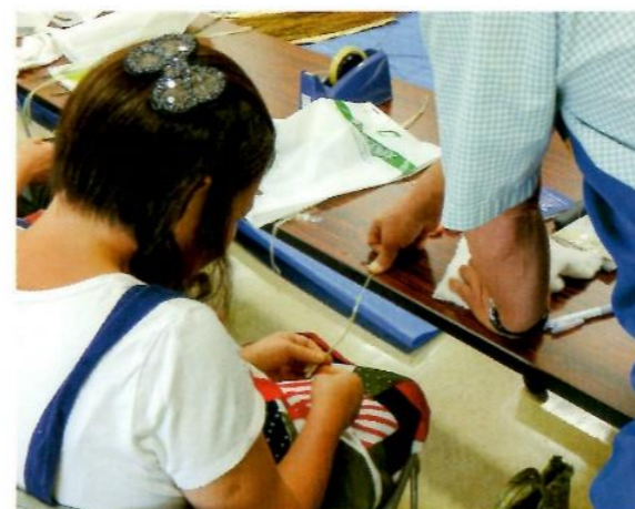
糸のより合わせを体験

植物のカラムシやアカソから糸を作りだします。 最後は先人が考案したアングイン編みで自分だけのティーマットを作ってみましょう。