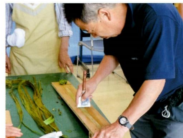
カラムシから繊維を取り出す「芋引き」に挑戦