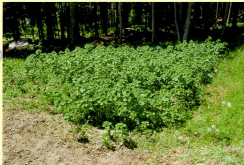
カラムシ畑の様子