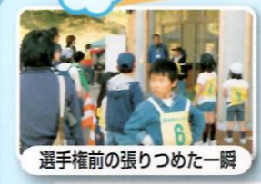
選手権前の張りつめた一瞬