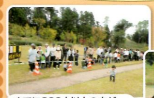
すでに200人以上の方が…