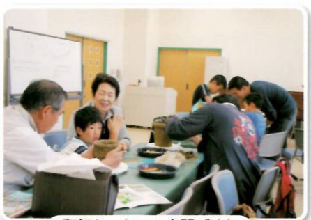
和気あいあいの土器づくり

幅広い年代の方をとらえて離さない土器製作、今回も世代を超えたご参加をいただきました。いつもはテーマを決めての製作になりますが、今回はオリジナルということで、多彩なデザインがそろいました。一月後の野焼きを経てエントランスホールに展示された作品は、来館者の関心をひいておりました。