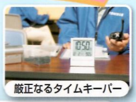
厳正なるタイムキーパー