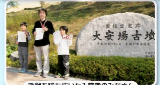
激戦を勝ち抜いた入賞者のみなさん