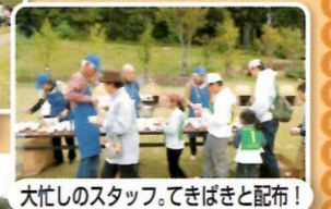
大忙しのスタッフ。てきぱきと配布！