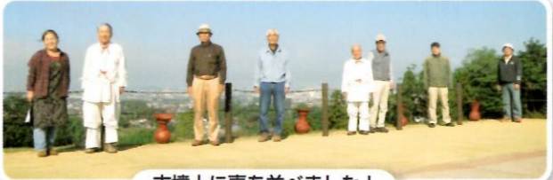
古墳上に壺を並べました！

当園全域がコースのウォークラリーや大人気の火おこし選手権、「赤いトマト」による人形劇、古代グルメ「いしる鍋」などを開催しました。夏祭り以上に開園直後からたくさんの来園があり、「楽しみにきました」という有り難いお言葉も…。みなさん、本当にありがとうございました。