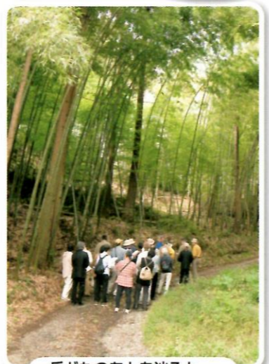
兵どものあとを辿ると…