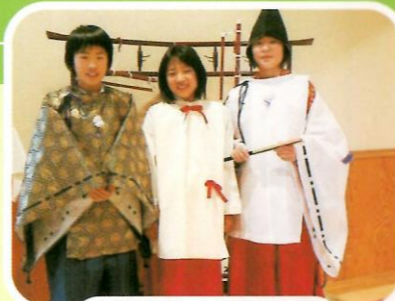
古墳時代/古代の衣装