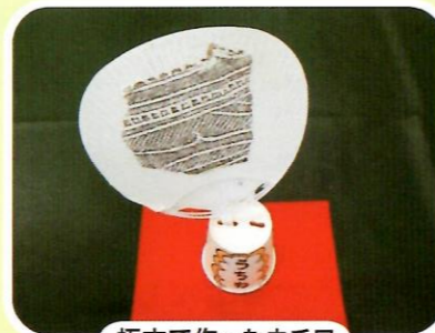
拓本で作ったウチワ