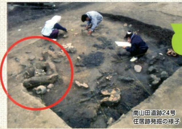
南山田遺跡24号住居跡発掘の様子