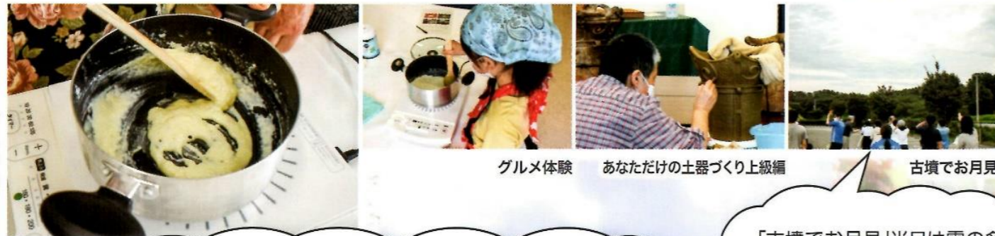
グルメ体験 あなただけの土器づくり上級編 古墳でお月見

今年度は全部で20の事業を開催しました。感染症対策にご協力いただいた皆様、ありがとうございました。古墳まつり等、三密を防ぐことが難しい大規模な事業は残念ながら中止いたしました。来年度以降の開催を楽しみにお待ちしておりますと幸いです。