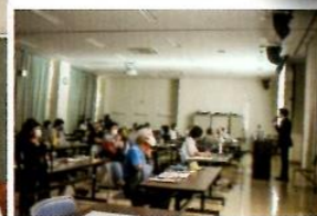
第1回企画展記念講演会