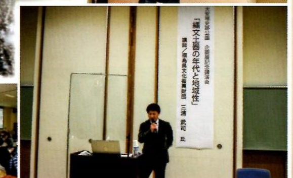
第2回企画展記念講演会