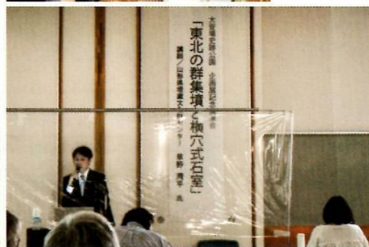
第1回企画展記念講演会

「陶器づくり」は、例年より定員を制限しての実施でしたが、素敵な作品が並びました。