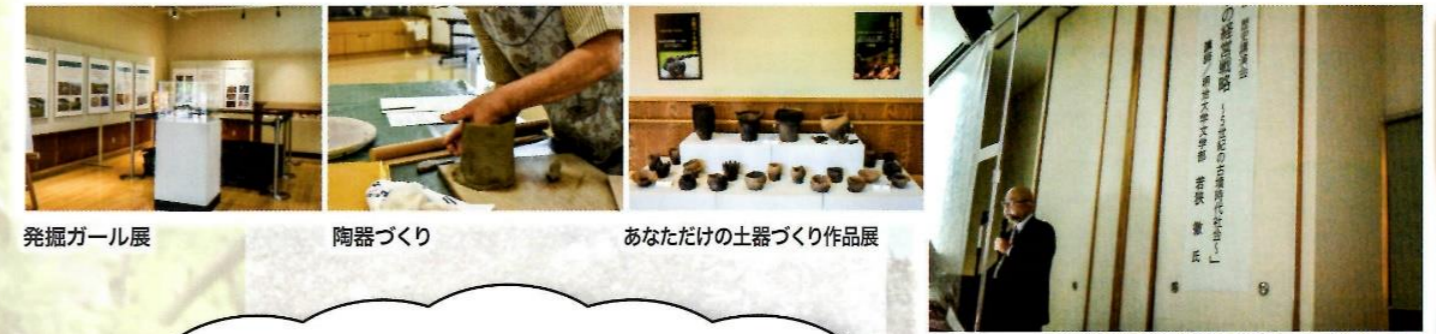
発掘ガール展 陶器づくり あなただけの土器づくり作品展