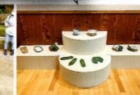
陶器づくり作品展