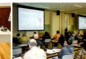
第2回企画展記念講演会