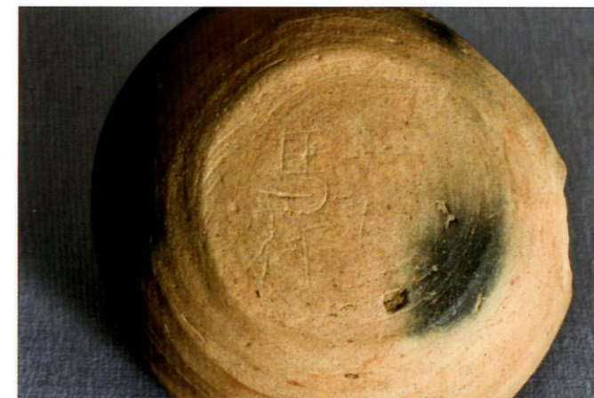
「馬」刻書土器（妙音寺遺跡）