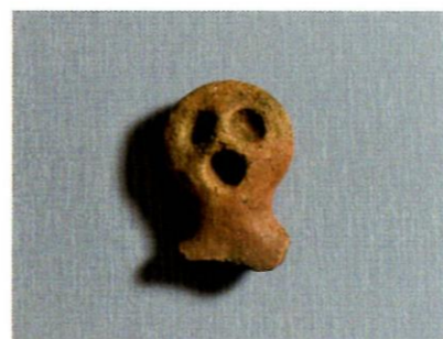
土偶（小泉山田 A 遺跡）