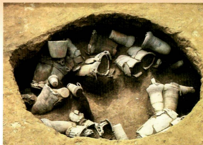
貯蔵穴の土器出土状況（妙音寺遺跡）

特に、堂坂の妙音寺遺跡では190基もの貯蔵穴が見つかり、たくさんの土器が出土しました。中には30個体以上の土器が入っていた貯蔵穴もありました。