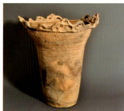
縄文時代中期の土器（妙音寺遺跡）