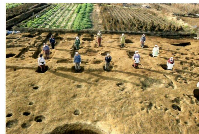
掘立柱建物跡（妙音寺遺跡）