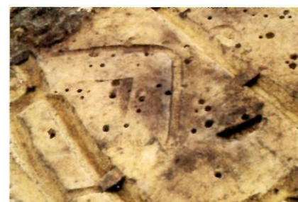
古墳時代の竪穴住居跡（上之内遺跡）

古墳時代には福原の陣場周辺に古墳が作られたようです。小十郎垣古墳が現在も残っています。また、上之内遺跡では集落も見つかりました。