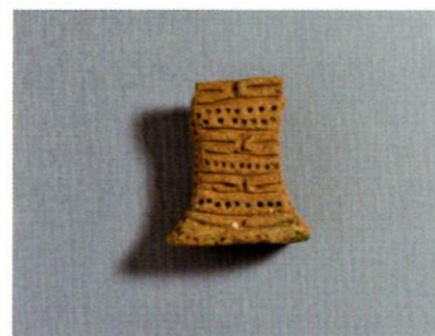
土偶（小泉山田 A 遺跡）