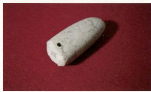
▲ヒスイ製大珠(馬場中路遺跡)

ヒスイは緑色をした宝石です。縄文時代から装飾品などとして利用されており、郡山市内でも馬場中路遺跡などで見つかっています。ヒスイの原産地は新潟県糸魚川市にあり、交易によって持ち込まれたものと思われます。