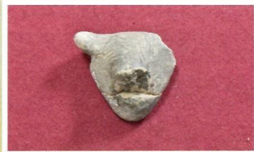
▲アスファルトが付着した土偶