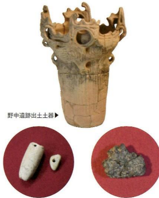
野中遺跡出土土器▶