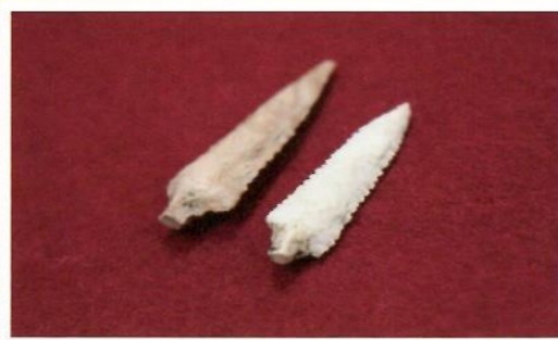
▲アスファルトが付着した石のやじり(町B遺跡)

縄文人たちは天然アスファルトを接着剤として利用してきました。郡山市内では町B遺跡などでアスファルトの塊 かたまり が見つかっています。アスファルトの産地は秋田・山形・新潟県など日本海側にあります。郡山市内で見つかったアスファルトも、日本海側との交易によるものと思われます。