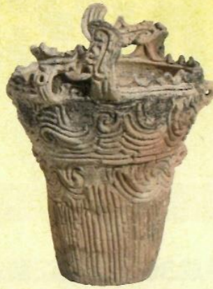
▲火焰型土器(妙音寺遺跡)

新潟県で盛行した「 かえんがた 火焰型土器」や、関東地方の土器が郡山市内でも見つかっています。特に、 みょうおんじ 妙音寺遺跡で見つかった火焰型土器は、本場である新潟県の土器の作り方に近いものです。本場の土器の作り方を熟知している人が作ったものかもしれません。