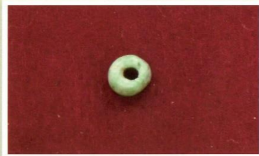
▲ヒスイ製ペンダント(町B遺跡)