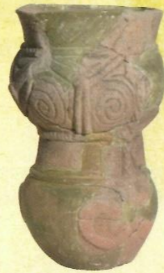
▲関東系の土器(鴨打A遺跡)