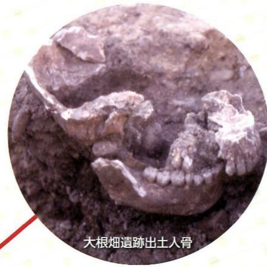
大根畑遺跡出土人骨