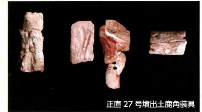
正直 27号墳出土鹿角装具

正直27号墳から見つかった鹿角製の剣の装具は、朱も塗られています。鹿の角は毎年生え変わるので、再生や子孫繁栄の意味が込められていたのではないかと考えられます。