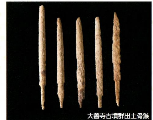
大善寺古墳群出土骨鏃

壙輪が持ち運ばれたのか、作り手が移動したのか、明確にできませんが、この壙輪の場合は作り手が移動して製作したものと考えられています。