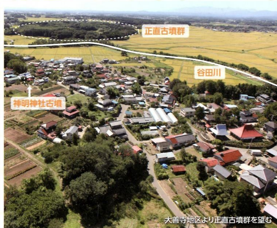
大善寺地区より正直古墳群を望む

位置関係に注目すると、大善寺古墳群は正直古墳群から見て谷田川を挟んだ対岸の高台に位置しています。比較的大きな川を挟んでいるので、正直古墳群を作った集団とはまた別の集団が、同じ時期に存在していたことが推定されます。両岸で古墳づくりを競い合っていたのかもしれない。