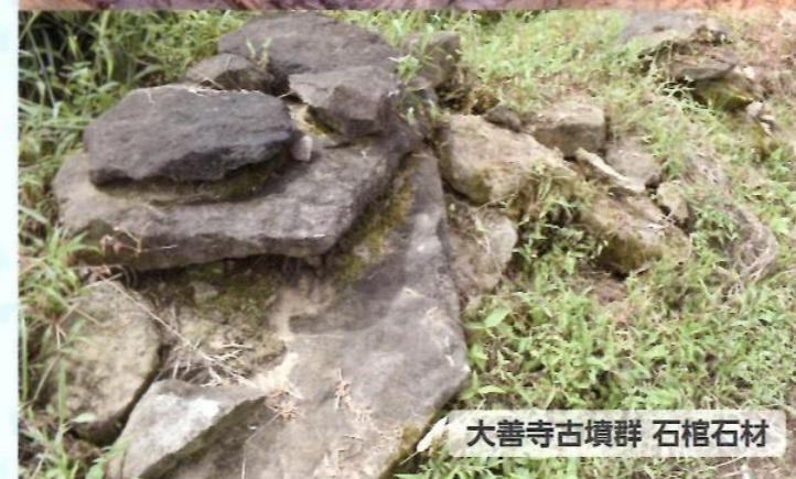
大善寺古墳群 石棺石材