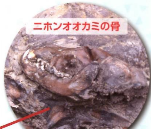
ニホンオオカミの骨

ここでは、当時使われていた井戸が多数確認されましたが、その1つからは絶滅してしまったニホンオオカミの全身骨格が出土しました。日本では当時3番目の出土例で、生物学的に見ても非常に貴重なものです。