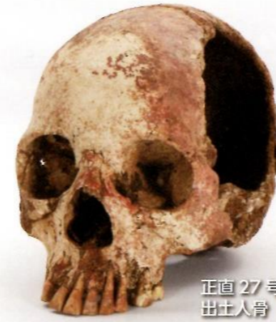
正直 27号墳 出土人骨