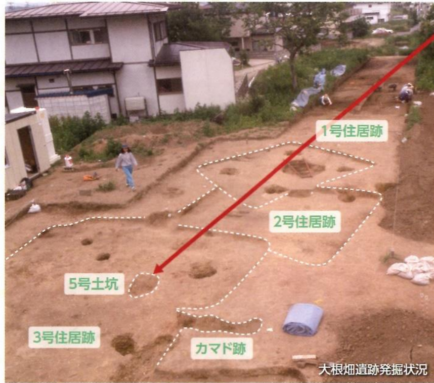
大根畑遺跡発掘状況

また、あまり知られてはいませんが、ここでは古墳時代の住居が埋没した後に掘られた穴から、人の足の骨や頭蓋骨が出土しています。周辺には、江戸時代までさかのぼれるお墓があることから、この人骨も同じ時代に埋められ、忘れられてしまったのかもしれない。