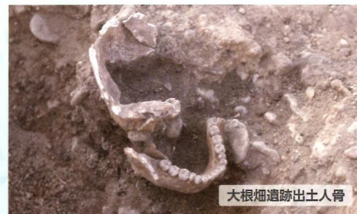
大根畑遺跡出土人骨