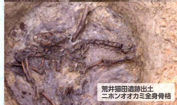
荒井猫田遺跡出土 ニホンオオカミ全身骨格