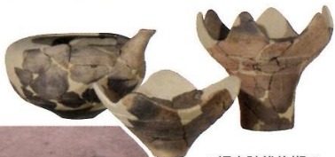
▲縄文時代後期の土器(築場遺跡)

日和田町では、 やまば 築場遺跡(高倉)、 ほっちゅうめたてあと 八丁目館跡(八丁目)などで縄文時代の土器が見つっています。その中でも築場遺跡は阿武隈川西岸の自然堤防上に形成された遺跡で、縄文時代後期中ごろ(約3,500年前)の集落が見つかりました。