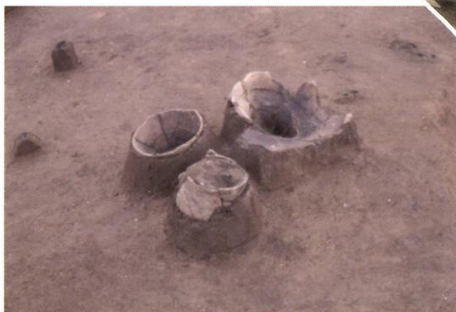
◀築場遺跡1号住居跡土器出土状況