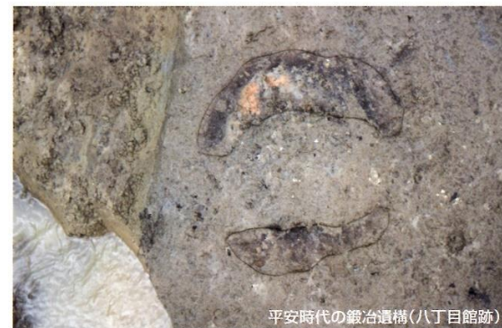
平安時代の鍛冶遺構(八丁目館跡)

平安時代は新田開発が行われ、集落数が増加する時代です。日和田町でも集落数は増加すると思われますが、現在のところ調査数はあまり多くありません。しかし、八丁目館跡(八丁目)で平安時代の鍛冶遺構が見つかり、鉄器の生産が行われていたことが分かります。