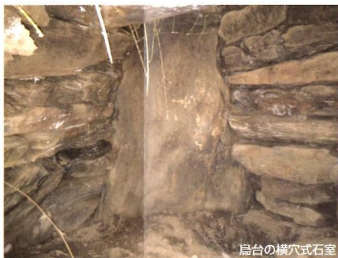
烏台の横穴式石室

日和田町には古墳時代の遺跡はあまり多くありません。しかし、高倉の烏台というところに人工の横穴式石室があることが古くから知られていました。正式な調査は行われていませんが、古墳時代後期の横穴式石室と考えられています。