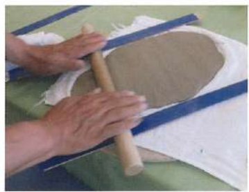
かがやくうつわ陶器づくり