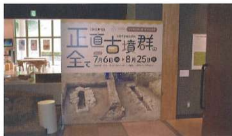
郡山市制施行100周年記念第1回企画展