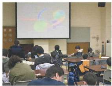
こども映画上映会