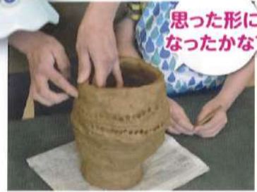
はじめての土器づくり

今年度は新しい指定管理期間が始まった年だったため、イベント名の変更や追加をしました。「おおやすば」は皆さんと一緒に楽しむ「場」です。