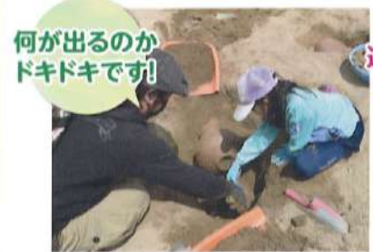
わくわく発掘探検隊①