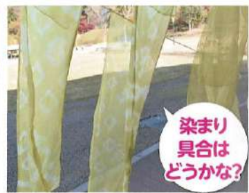
古墳の里の草木染め①