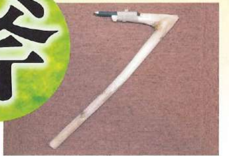
全体の鉄斧復元状況