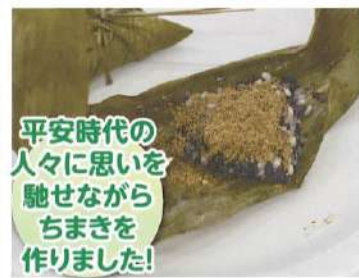
おおやすばグルメ体験①