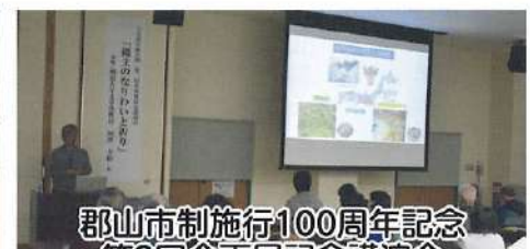
郡山市制施行100周年記念 第2回企画展記念講演会 「縄文のなりわいと祈り」