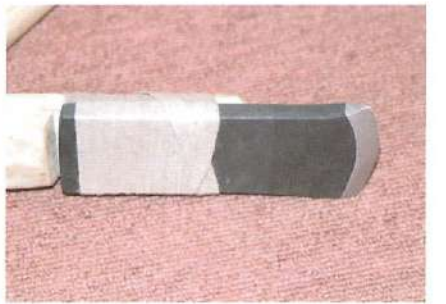
鉄斧復元状況(刃部拡大)