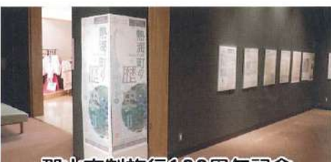
郡山市制施行100周年記念 第2回企画展